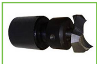
Фреза для ЗАКРУГЛЕНИЯ в комплекте