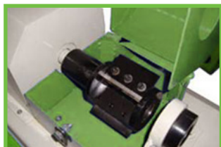
Фреза для КОНУСА в комплекте